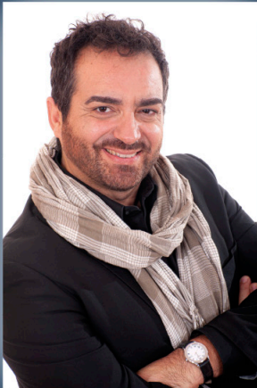
GIANLUCA TERRANOVA tenore